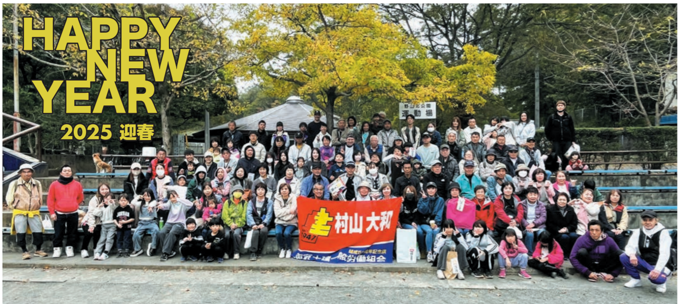
支部健康ウォーキング (2024年11月10日)

東京土建村山大和支部ホームページ http://www.murayamayamoto.jp 東京土建 村山大和支部 検索